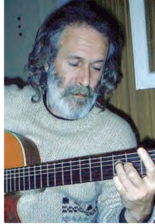
Por Gustavo Zurbano

Seis años atrás, la "picardía" entre un sector gremial de los músicos y un diputado del Peronismo Federal permitió poner en vigencia una vieja ley que, con el pretexto de regular nuestra precarizada actividad, era una caja recaudatoria de matrículas y exámenes obligatorios para quienes quisiéramos desempeñarnos en este noble oficio.